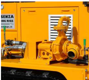
Pompa fango Mud pump Pompe à boue Spülpumpe Bomba de lodo Грязевой насос