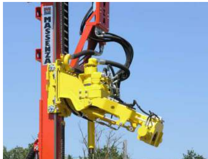
Braccio carica aste Rods loading arm Bras de chargement de tiges Brazo de carga barras Bohrrohr handling system Автоподатчик штанг