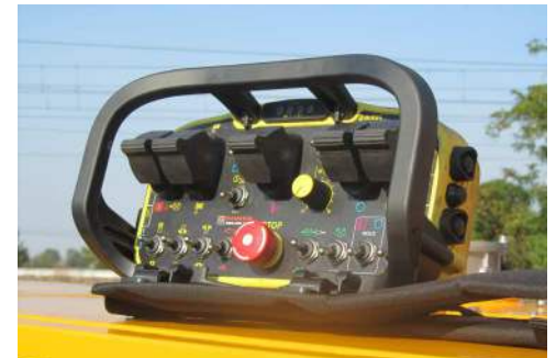
Radiocomando Radio remote control Télécommande Mando a distancia Fernbedienung Пульт радиоуправления